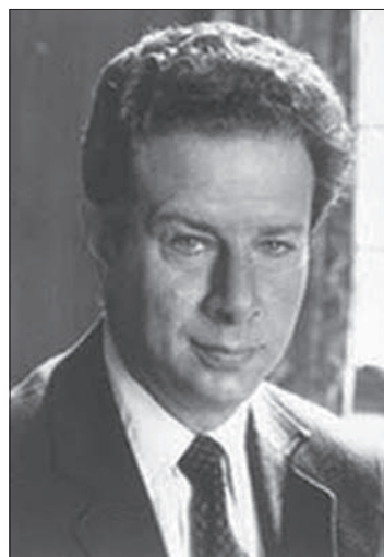
Сідні Олтмен (1939)

Сідні Олтмен (англ. Sidney Altman ) народився в 1939 році в Монреалі. Для Сідні та його сім'ї, бідних емігрантів із Радянського Союзу, Канада стала країною реальних можливостей